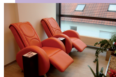
Massagesessel Bad Tauberbischofsheim