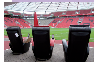
Massagesessel Bayer Leverkusen